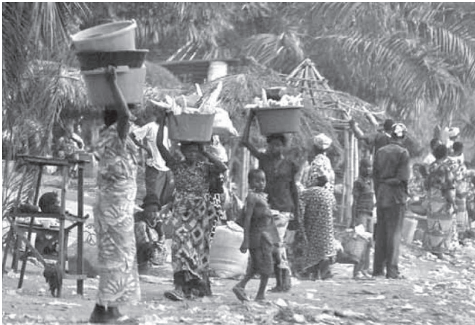
Le transport, une corvée. Comment améliorer les conditions de travail des femmes, faciliter leur approvisionnement en eau et bois de cuisine? La femme dépense plus d'énergie à transporter qu'elle n'en gagne par sa ration alimentaire quotidienne.

L'égalité des sexes, qui est inscrite dans les Droits de l'homme, est au cœur de la réalisation des Objectifs du Millénaire pour le Développement. Sans elle, on ne pourra vaincre ni la faim, ni la pauvreté, ni la maladie.